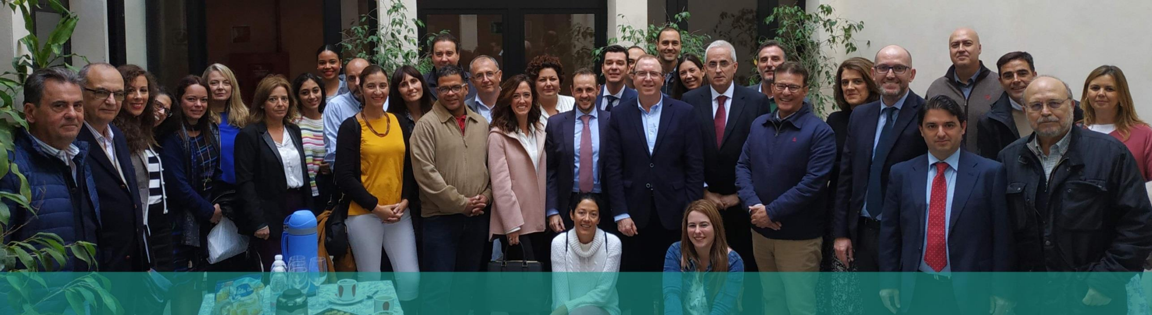
Jornada Incorpora 2018 en Jerez: Responsabilidad Social al servicio de la empresa