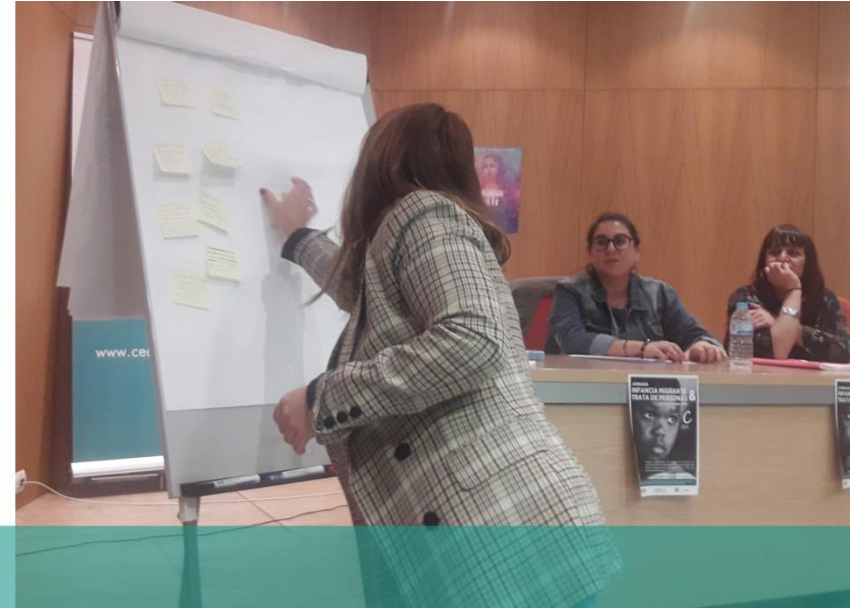
I Jornada Infancia Migrante y trata de personas organizada por CEAin en la Casa de las Mujeres de Jerez en 2018