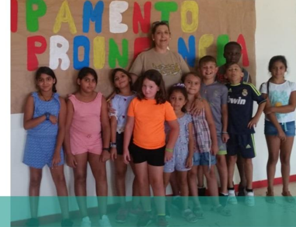
30 menores disfrutaron en 2018 de cinco días de campamento realizado en El Madrugador del Puerto de Santa María en el marco del proyecto Caixa Proinfancia