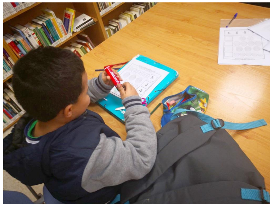
Uno de nuestros alumnos durante las sesiones de refuerzo educativo de Caixa Proinfancia en 2018

Los servicios han estado a cargo de las entidades de nuestra Red: Fundación Secretariado Gitano, responsable del refuerzo educativo y las colonias; ACCEM, encargada de los talleres familiares; Asociación Kenya, encargada de los campamentos; Proyecto Hombre, a cargo de las atenciones psicoterapéuticas y CEAin, además de ser entidad coordinadora, se encarga del refuerzo educativo, colonias, centro abierto (actividades de ocio) y gestión de las ayudas.