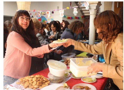
Participamos un año más en la Convivencia Intercultural desde la Gastronomía en la Casa de las Mujeres en Jerez