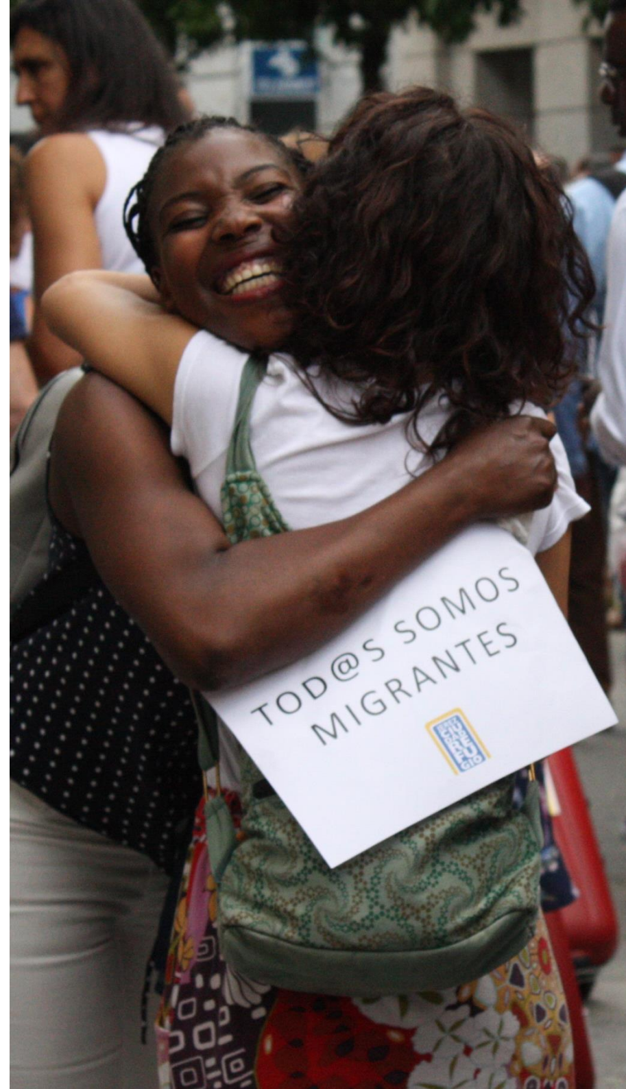
Imagen: Momento durante la marcha simbólica organizada desde la plataforma Jerez Ciudad Refugio en el Día Mundial de las personas Refugiadas en 2018

En 2018 CEAIN ha realizado una atención integral a 61 personas (21 familias) a las que se ha facilitado la cobertura de necesidades básicas (alojamiento, manutención, vestuario, etc.), así como asesoramiento y orientación en su proceso de integración sociolaboral.