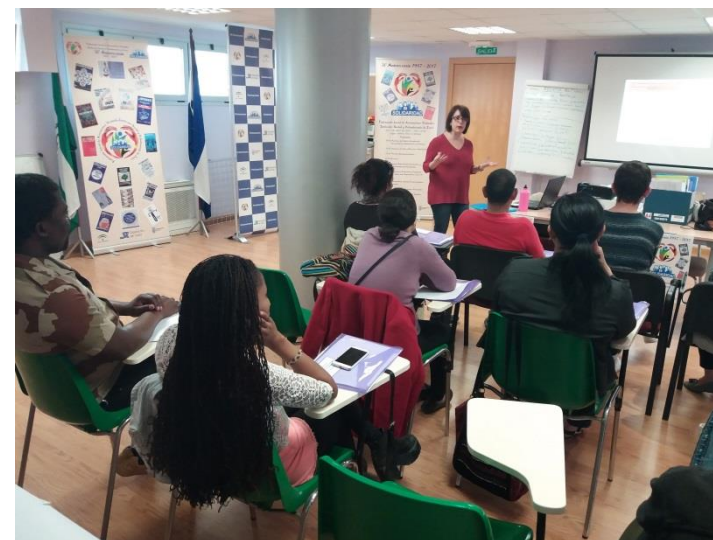
Sesiones formativas del área de Formación y empleo en 2018