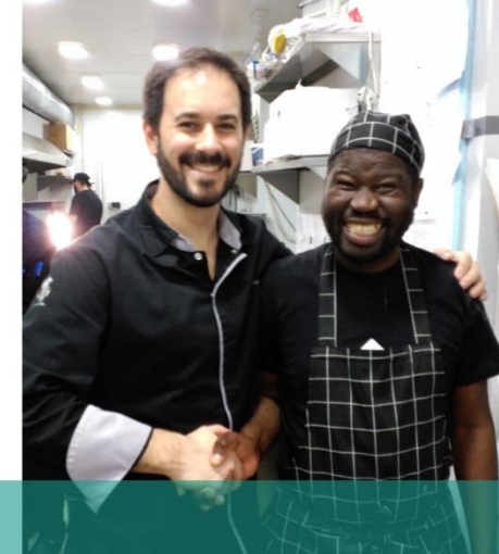
Operaciones básicas de cocina: una de las actividades formativas del programa GLOBALEmplea en 2018