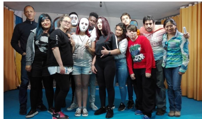
Nuestro grupo de jóvenes del proyecto de Arte y transformación social el día del estreno de su obra: ¿Por qué? Retratos de crueldad en el CEIP Torresoto de Jerez

En 2018 alrededor de 350 personas han participado en talleres y acciones de sensibilización. Se han formado como nuevos espacios libres de rumores el AMPA del CEIP Isabel la Católica. Se han realizado acciones de sensibilización desde la Plataforma Jerez ciudad refugio en fechas señaladas como el 21 de marzo (Día Mundial de la discriminación racial), 21 de junio (Día mundial del Refugiado) y 18 diciembre (Día internacional del Migrante).