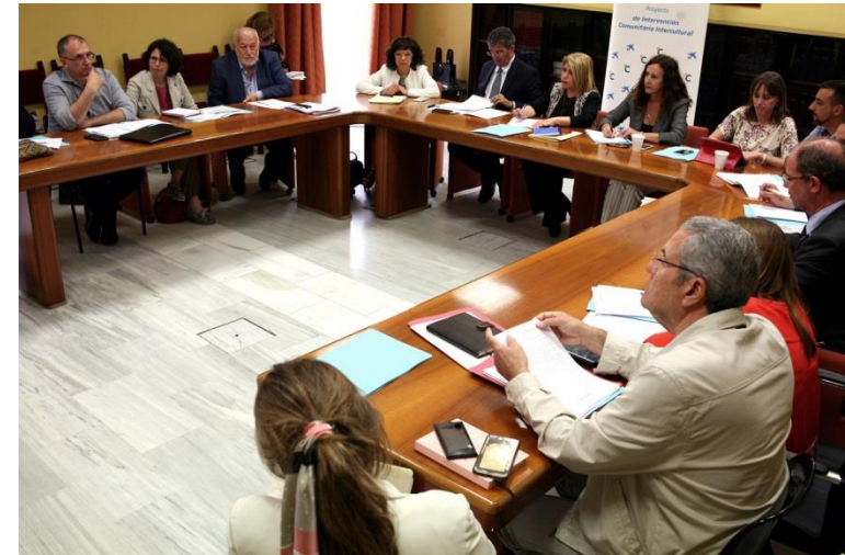
Espacio de Relación Institucional (ERI) 2018 del Proceso Comunitario Intercultural en el Ayuntamiento de Jerez