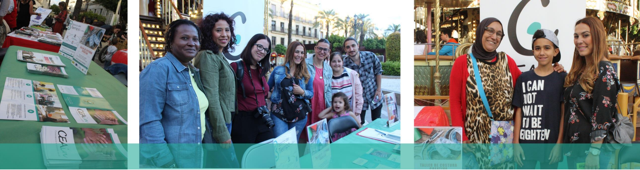
Stand de CEAin en la Fiesta Jerez - África 2018 con algunas personas de nuestro equipo técnico, usuarios/as y voluntariado