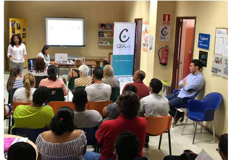
Uno de los talleres sobre derecho en materia de extranjería impartido por nuestras abogadas en nuestra sede en 2018

A través de este programa hemos prestado asesoramiento a personas de origen extranjero privadas de libertad , en materia de extranjería, procedimientos penales y funcionamiento de la prisión. Asimismo, se ha mediado con abogados/as y familiares y realizado acciones informativa y formativas, así como lúdico-culturales, destacando el III Ciclo de Cine y Convivencia. En total se han atendido a 139 personas.