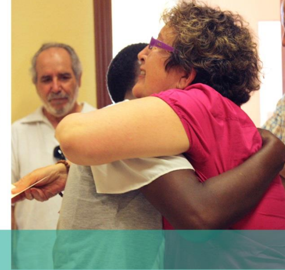
Entrega de diplomas de las clases de español junto a los profesores del voluntariado / Día Internacional del Voluntariado en Jerez 2018