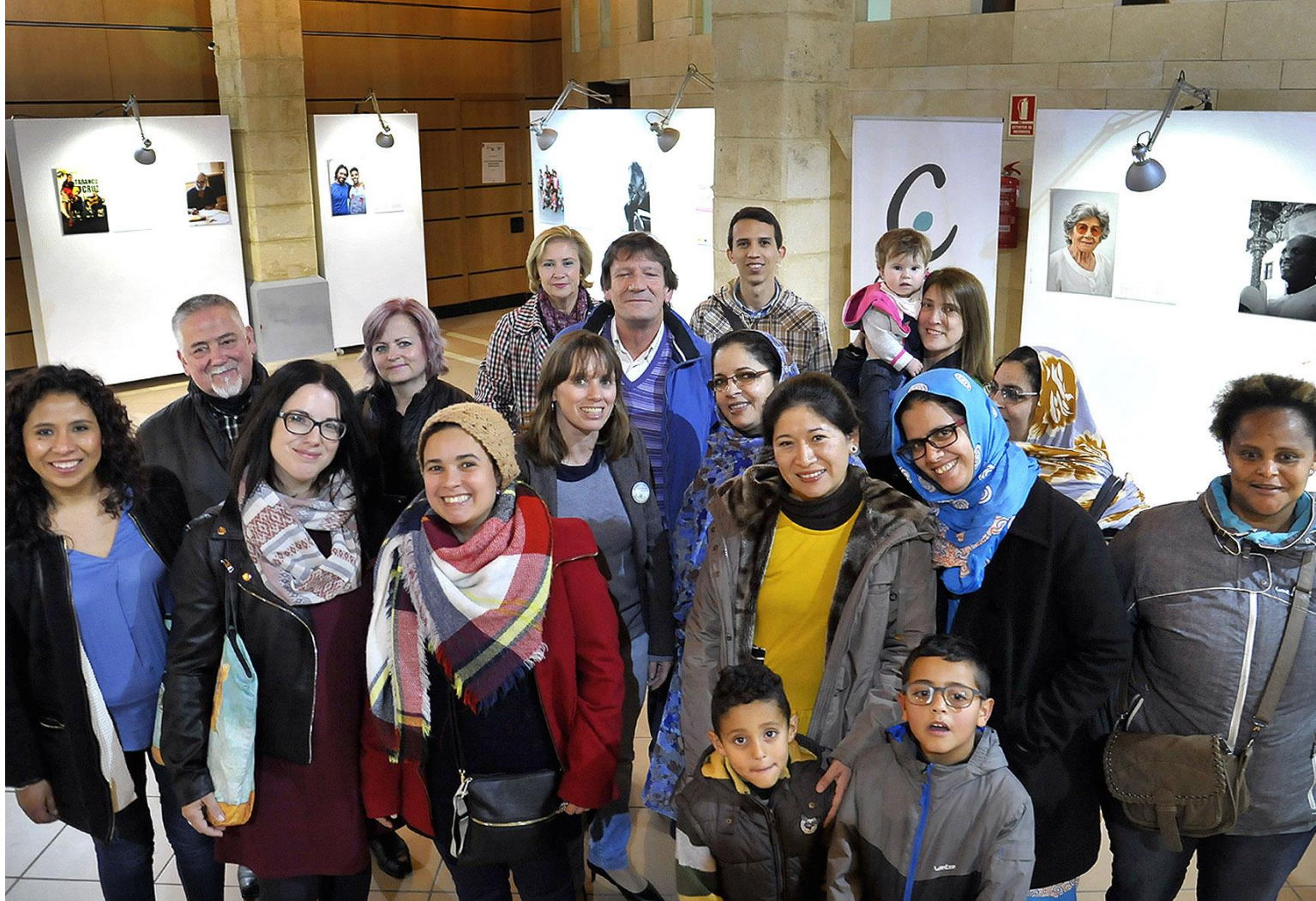
Inauguración de la exposición San Miguel Diverso en la Sala Paúl de Jerez el 21 de Marzo de 2018: Día Mundial de la Eliminación de la Discriminación Racial

- Para visibilizar los nexos comunes presentes en un barrio con tanta diversidad en 2018 hemos llevado la exposición San Miguel Diverso a diferentes puntos de Jerez: Ateneo de Jerez, Sala Paúl y la Gotera de la Azotea.