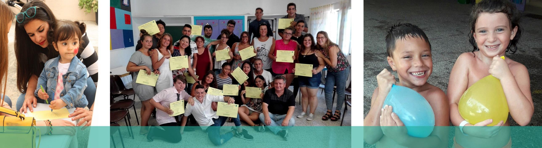
Algunos momentos del Proceso Comunitario Intercultural en 2018: Encuentro Comunitario / Formación de Animadores juveniles / Escuela Abierta de Verano