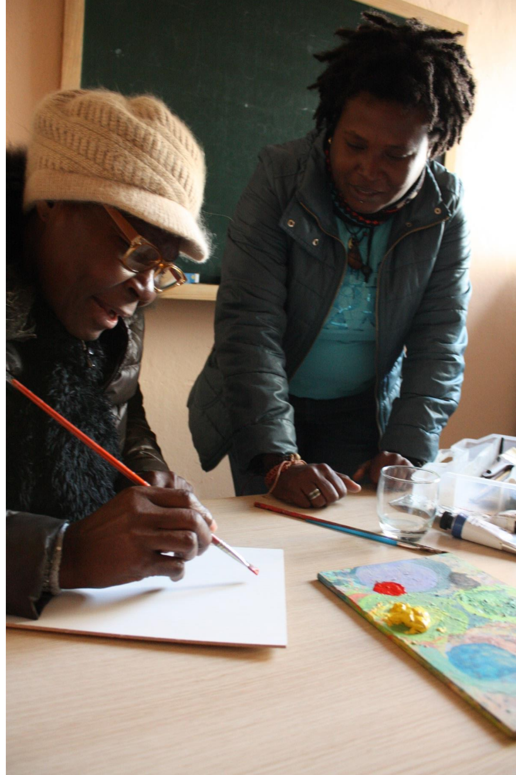
Imagen: Dos participantes de nuestro Banco del Tiempo durante un intercambio de clase de pintura artística en CEAIIn

Participamos en las III Jornadas Técnicas del Banco del Tiempo Economías colaborativas: Una mirada hacia el futuro en Sevilla, para hablar de la experiencia del Banco del Tiempo de CEAIIn en Jerez como ejemplo de buenas prácticas en economías colaborativas.