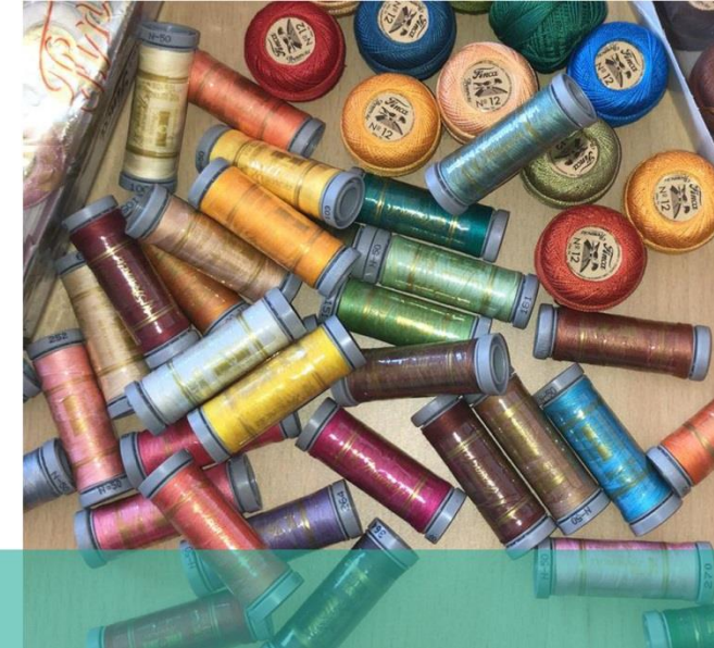
Algunos momentos en nuestro espacio semanal de encuentro de costura creativa en CEAin durante 2018