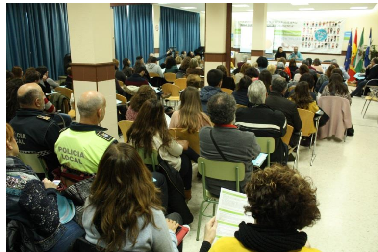
Celebración del XI Espacio Técnico de Relación Trabajamos juntos por el Desarrollo Local en 2018

Diferentes colectivos de la zona como: Asociación de Mujeres Zenobia, Asociación Mujeres Manos Abiertas hacia el Futuro, A.VV. Azul y Blanca, Colectivo Mujeres San Telmo, y A.VV. Apóstol San Pablo. Adecosur Grupo Espacio Zona Joven, Grupo Familias al Sur y Grupo Comunitario.